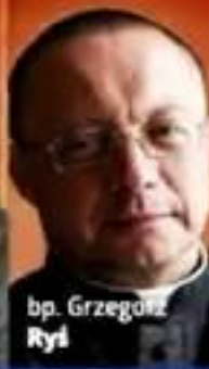
bp. Grzegorz Ryl