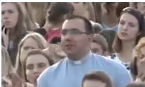
Kadr z koncertu w 2014 r. 8

„Jednego Serca Jednego ducha” jest organizowane przez odnowę w 'Duchu Świętym'! 7 Oto jak Jezuicki koń trojański chce zniszczyć Zielonoświątkowców i Charyzmatyków!