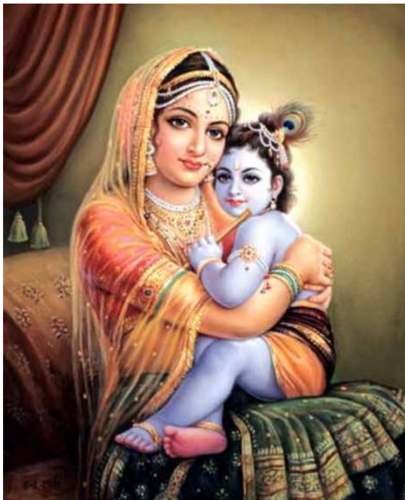
Matka z dzieckiem!

Poniżej znajduje się obrazek Matki z dzieckiem!