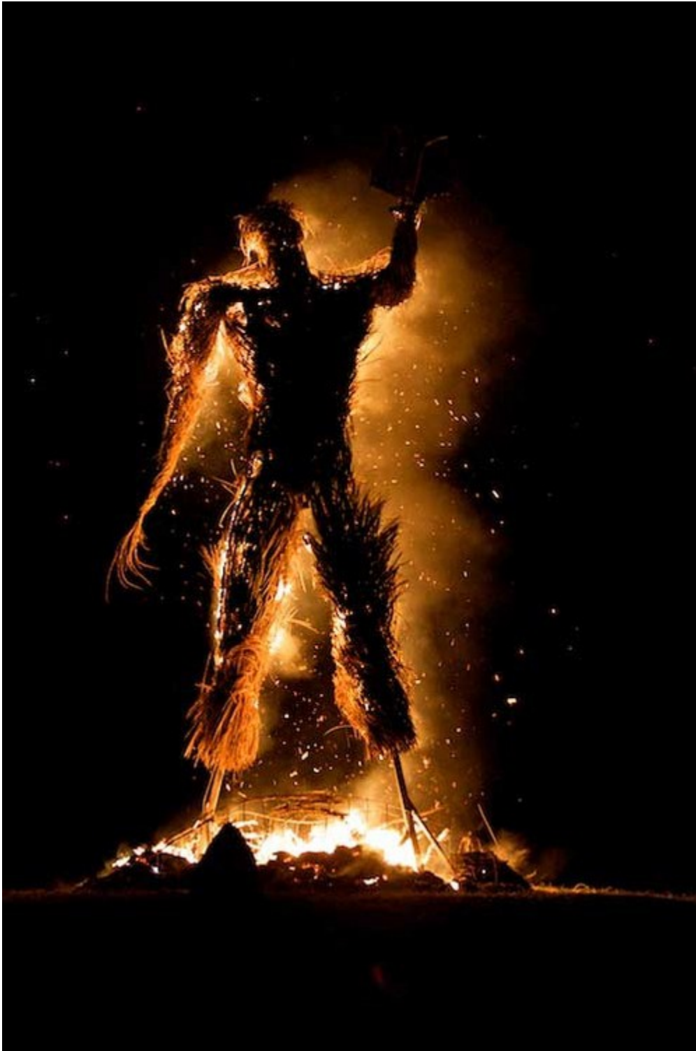
Człowiek z wikliny

Jednym z aspektów Babilońskich, połączonych z ofiarami, było małżeństwo i rytualna kopulacja! Nazywa się to hieros gamos , i podobne ‘małżeństwa’ można spotkać u Devadasi w Hinduizmie,