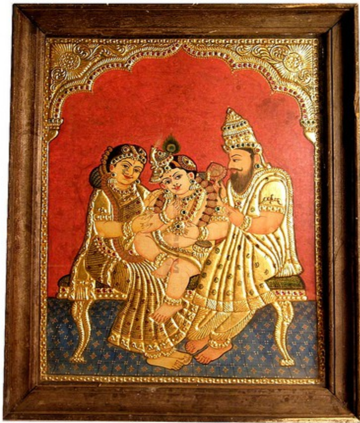
Yasoda, Kriszna, Vasudeva