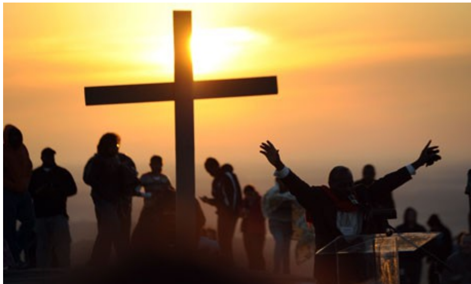
Nabożeństwo o wschodzie słońca !

Niektórzy w Protestantyzmie robią podobnie i idą do zborów na tzw sunrise service - usługa o wschodzie słońca! Czy nie widzimy jak pogaństwo się zakorzeniło?