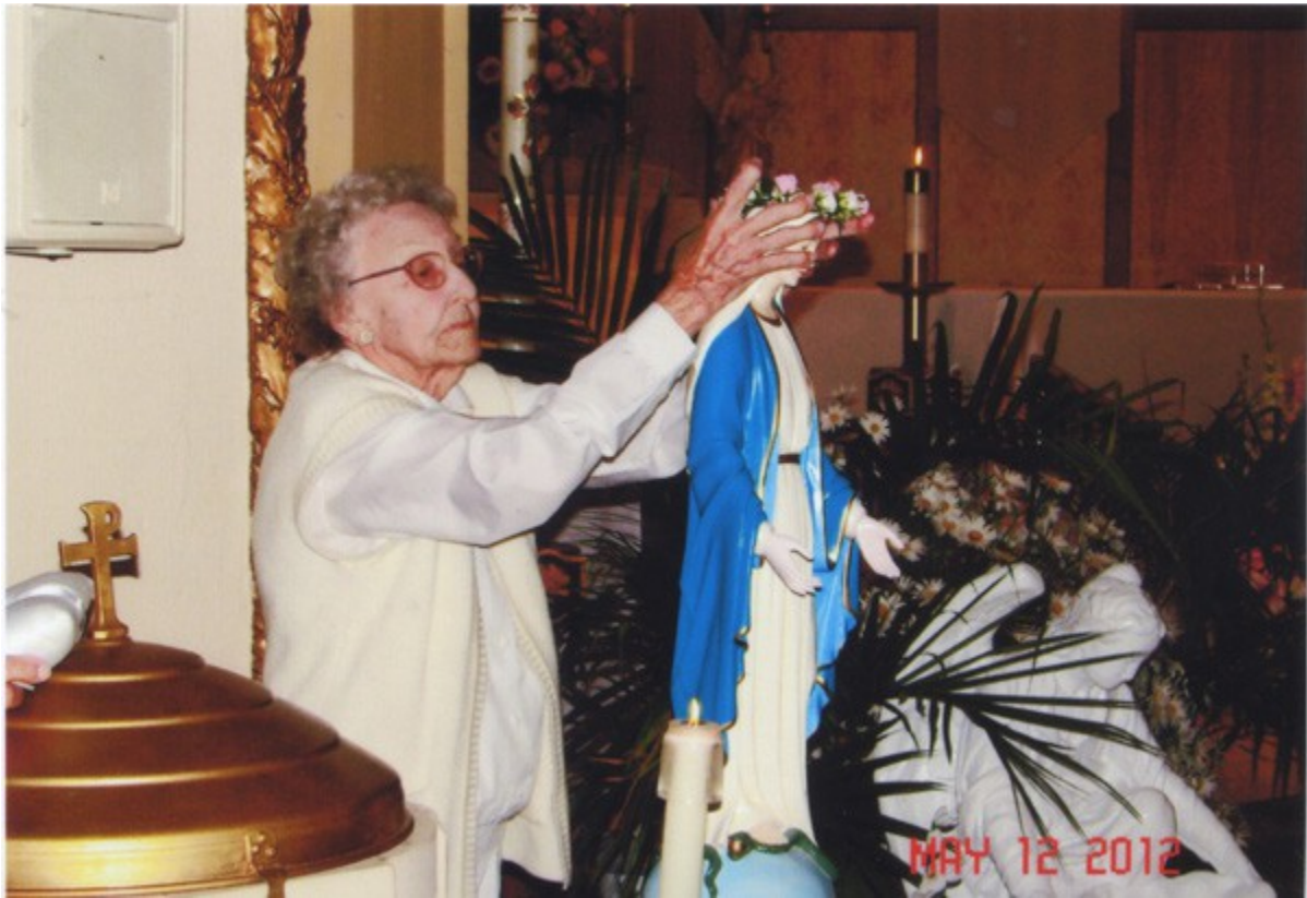
Babcia różańcowa, biedna kobiecina, nie czytała Biblii i drugiego przykazania!