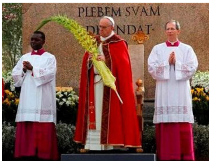
Niedziela Palmowa obchodzona wokół Obelisku wg gazety The Star!

“Papież Francis rozpoczyna Mszę Niedzieli Palmowej na obelisku na Placu Świętego Piotra w Watykanie 24 marca” The Star