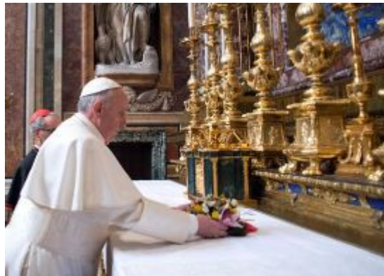
Franciszek bałwochwalczy, przynosi kwiaty dla demona Isztar!