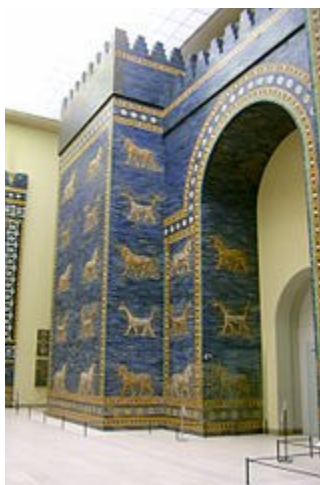
Brama babilońskiej Isztar, dziś w Berlinie!

“ Brama Isztar – monumentalna brama w starożytnym Babilonie , wzniesiona za panowania Nabuchodonozora II , który panował w l. 605-562 p.n.e. i poświęcona była bogini Isztar . Była ona północną bramą miasta, otwierającą tzw. drogę procesyjną, która ciągnęła się aż do świątyni Marduka – E-sagila .”